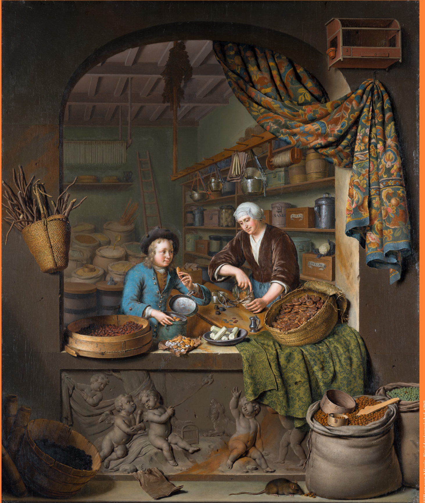
Willem van Mieris, Kruidenierswinkel , 1717