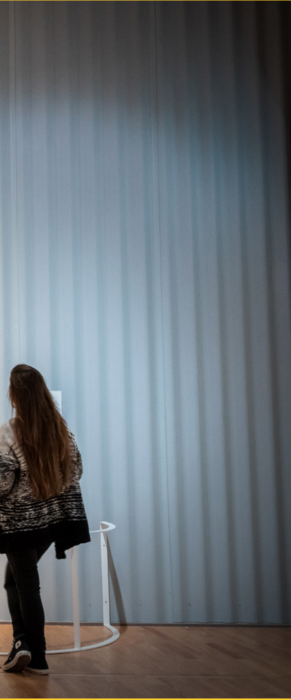
George Strubbs, Whistlejacket , c. 1762, National Gallery