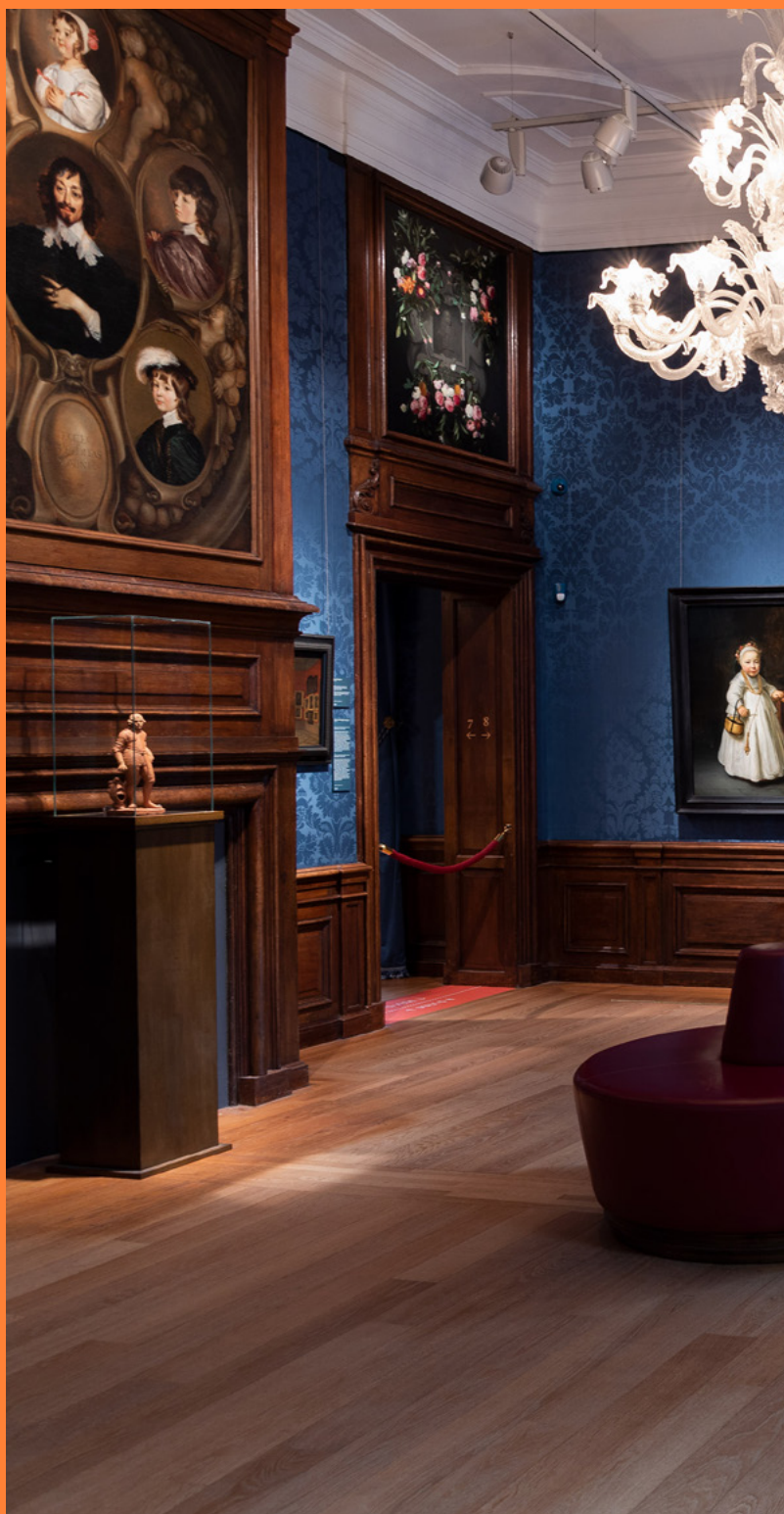
Zaal 8, zie pp. 36-37